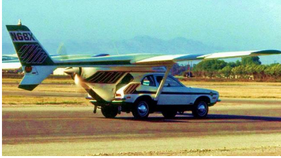
الأفكار العبقورية تسهم في التقدم العلمي

من جانب آخر، فإن الاختراع (Invention) بحسب تعريف كولتر وروبينز (Coulter and Robbins) "هو التوصل إلى فكرة جديدة بالكامل ترتبط بالتكنولوجيا وتؤثر على المؤسسات المجتمعية". وبحسب القواميس اللغوية فإن الاختراع هو "شيء لم يتم عمله من قبل، أو عملية إنشاء شيء لم يتم صنعه من قبل" وفي تعريف آخر هو "جهاز أو طريقة أو تكوين أو عملية فريدة أو جديدة". فالاختراع (Invention) هو إيجاد فكرة عبقرية تسهم في التقدم العلمي، أما الابتكار (Innovation) فهو تحويل تلك الفكرة إلى عمليات أو منتجات جديدة لها تأثير اقتصادي مقاس. وفي إطار فهم العلاقة بين الابتكار والاختراع نجد