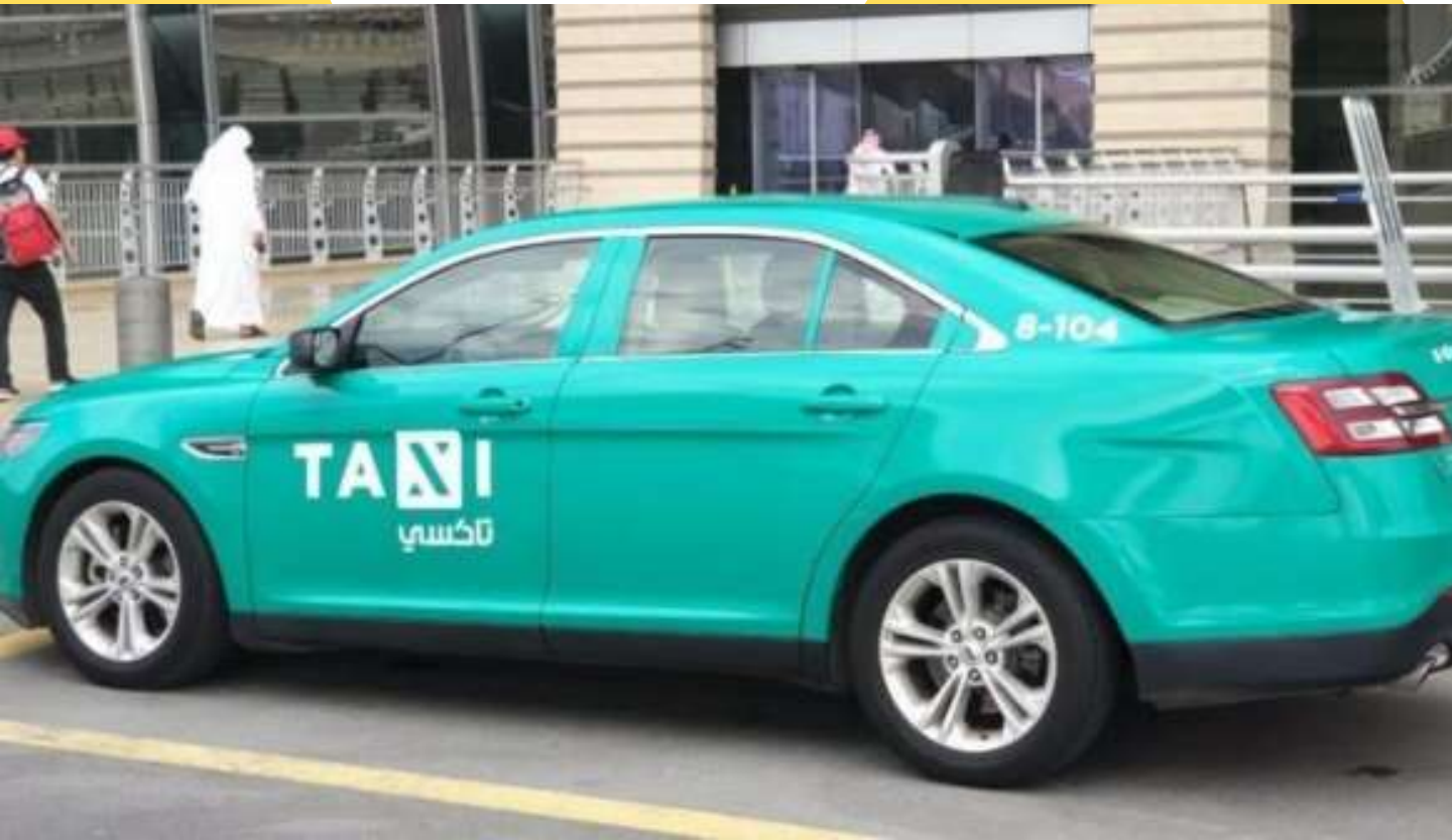
النقل التشاركي عطل هيمنة نقل الركاب التقليدي